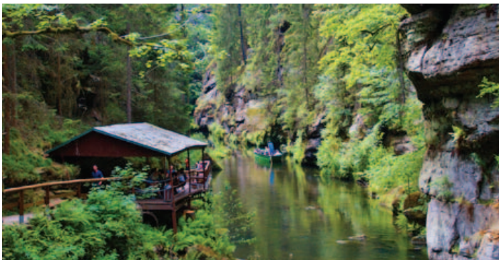
Edmundova soutěska, dříve nazývaná Tichá nebo Dolní, skalnatý kaňon řeky Kamenice, poslední ze tří soutěsek na dolním toku řeky, východně od Hřenska.

Nevíte kam o prázdninách na výlet? Navštivte turisti oblíbenou lokalitu České Švýcarsko. V rámci projektu Časná defibrilace v Ústeckém kraji vás zvedne na výhled z Pravčické brány a na plavbu soutěskami v Hřensku.