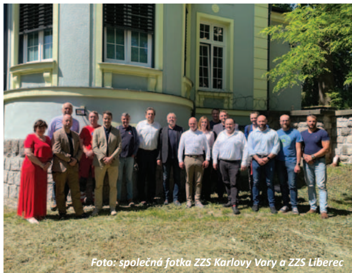
Foto: společná fotka ZZS Karlovy Vary a ZZS Liberec

Květen je tradičně měsíc sblížení a my jsme tuto tradici podpořili návštěvou Zdravotnických záchranných služeb Karlovarského a Libereckého kraje. Ačkoliv nedošlo na polibky pod rozkvetlou třešní, byla tato setkání